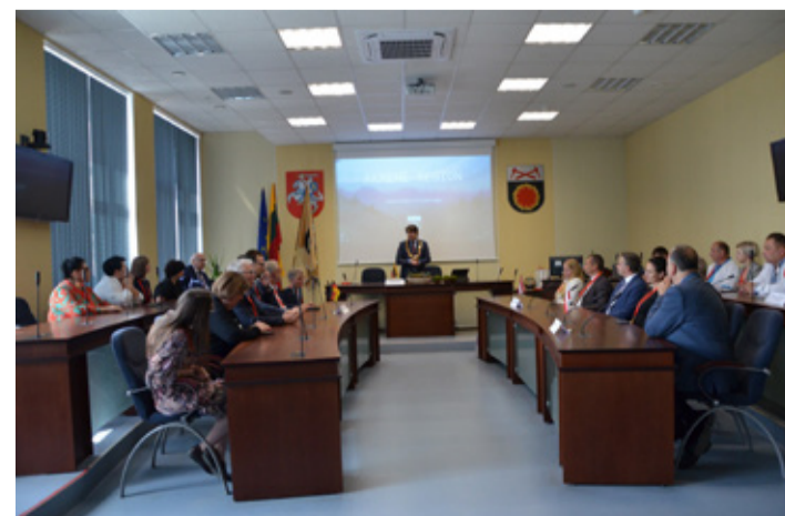
Juuni alguses külastas valla esindus Leedu sõpruslinna Akmenet, kus toimus viulifestival.