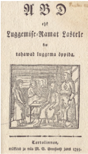
Masingu esimene lasteraamat, koduõppeks mõeldud „ABD ehk Lugemise-Ramat“ on alapealkirja järgi suunatud lastele, kes tahavad lugema õppida. Raamat sisaldab eessõnas oma aja kohta eesrindlikku lugema õpetamise meetodikat ja esmakordselt eesti keeles kirjavahemärkide seletusi. Pigem on tegu lugemiku kui aabitsaga, sest tähestiku ja veerimisharjutuste osa on selles väga napp (kolm lehekülge). Meie kultuurilugu hindab teost peamiselt selles sisalduvate ilmalike lugemispalade tõttu, religioossed tekstid on jäänud tähelepanuta, kuigi rõhutatakse, et need on varasemate aabitsatega võrreldes antud kokkusurutumalt. Masingu aabits-lugemikus puudub usutunnistus, mis oli toonaste aabitsate lahutamatu osa - kümne käsu ja meisapalve kõrval on toodud mõned lühikesed palved, mida laps saab lausuda hommikul, õhtul, söögi eest tänades või muudel elupuhkudel.

saaks omalt poolt panustada, kuid sellest ei piisa la-vastusele tingimuste loomiseks. Kahjuks ei ole teist korda samale tegevusele võimalik projektitoetust küsida, mistõttu jääb üle loota vaid ettevõtjate heatahtlikkusele.