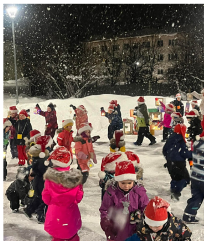
Kellukese päkapikud 1. advendil Kunda keskväljakul.