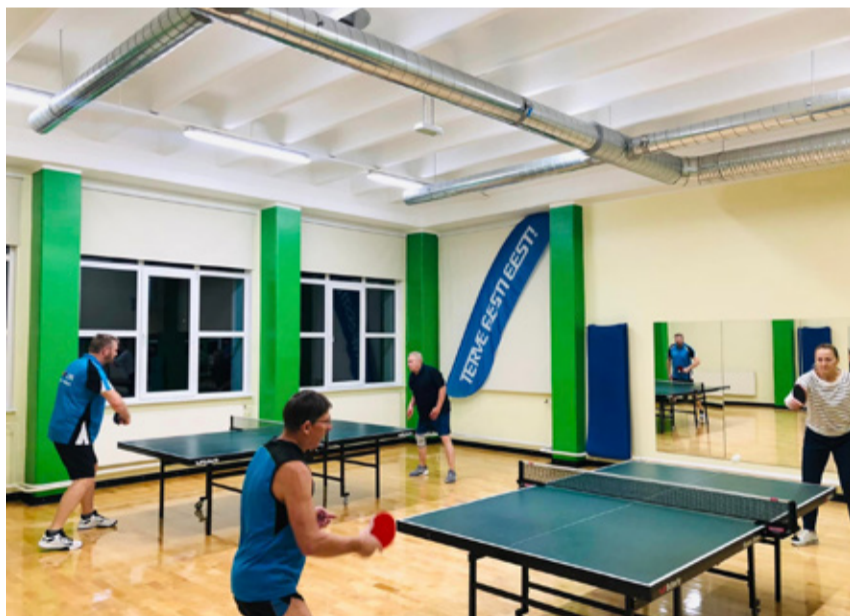
Lauatennise õpituba Kundas.