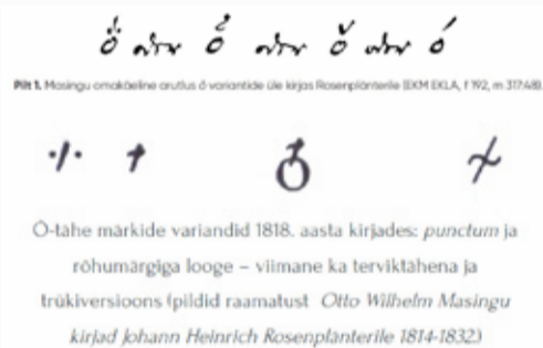
Õ-tähte erinevad versioonid.

Edasiste otsingute-katsetuste käigus sai paberile üksjagu variante: o, mille kohal kaks punkti, mille vahel veel püstkriips; o, mille kohal kaldristike; õ ja ö. 1818 telliti Peterburist trükitüüp teise jaoks. Seda oodates kasutas Masing aga esimest varianti, avaldades oma „Pühhapäwa Wahhe-luggemiste“ (1818) eessõnas palve, et „säärane „wõeras poohkstaw“ lugejaid ei pahandaks, õige tähekuju on tellimisel, see pole saabunud ja