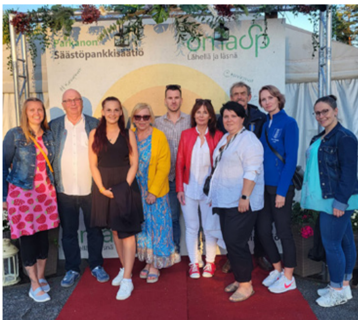
Augusti alguses osales valla esindus Soome sõprusvalla Karvia valla päevadel.

Suve viimasel päeval kuulutas Maa-amet, et eestlaste lemmik supluskohtaks on Kunda rand. Maa-ameti üleskutsele oma selle suve lemmik ujumiskoht kaardile märkida reageeriti aktiivselt ja kokku märgiti kaardile koguni 384 supluskohta. Kõige enam neist nimetati lemmikuna Kunda randa.