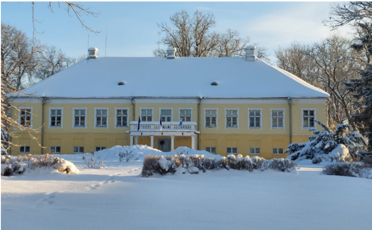
Meie armas mõisakool.