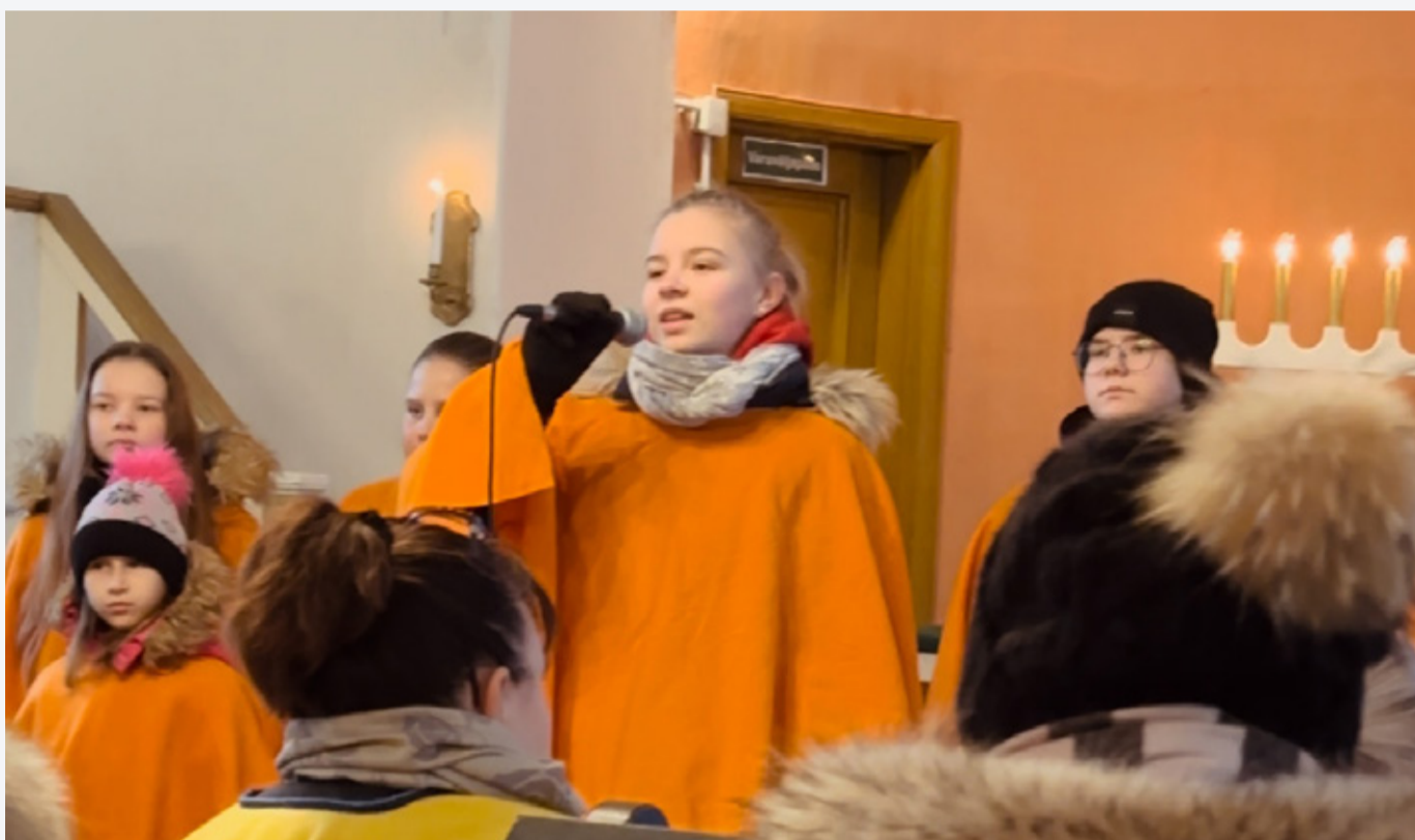
1. advent Kunda kirikus.