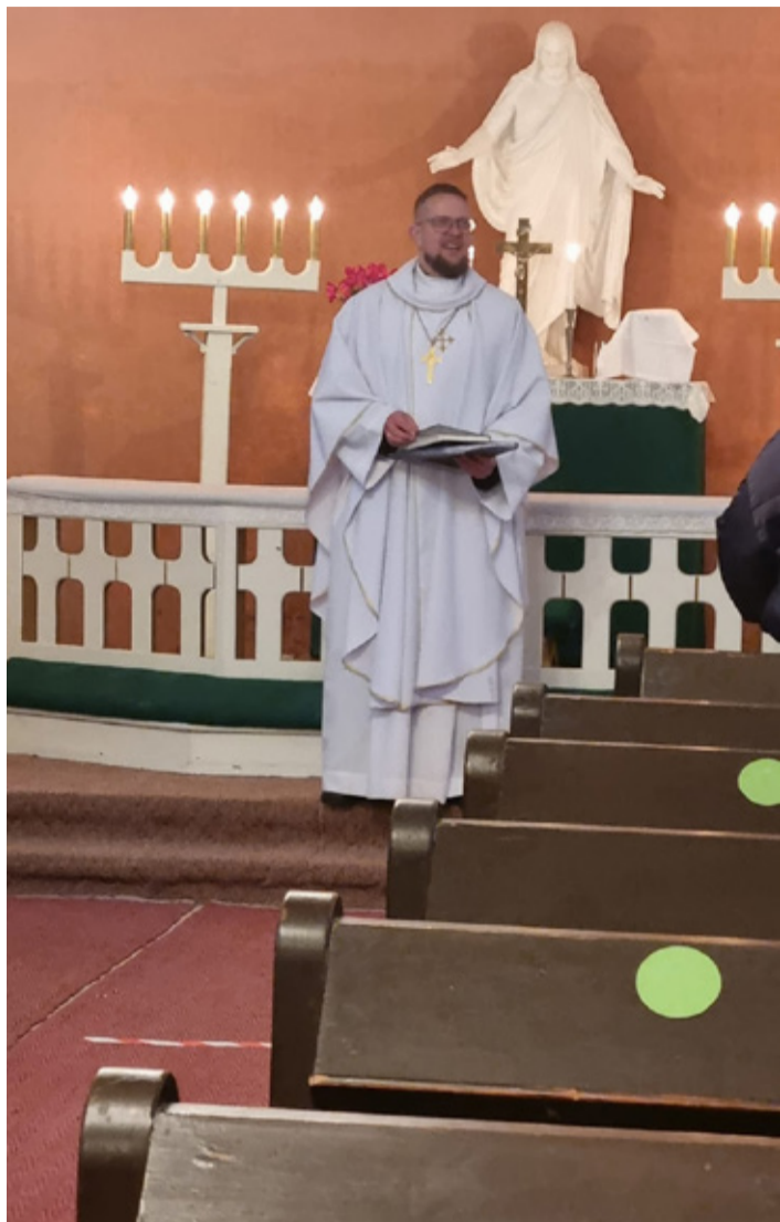
Kunda kirik tähistas 95. aastapäeva.