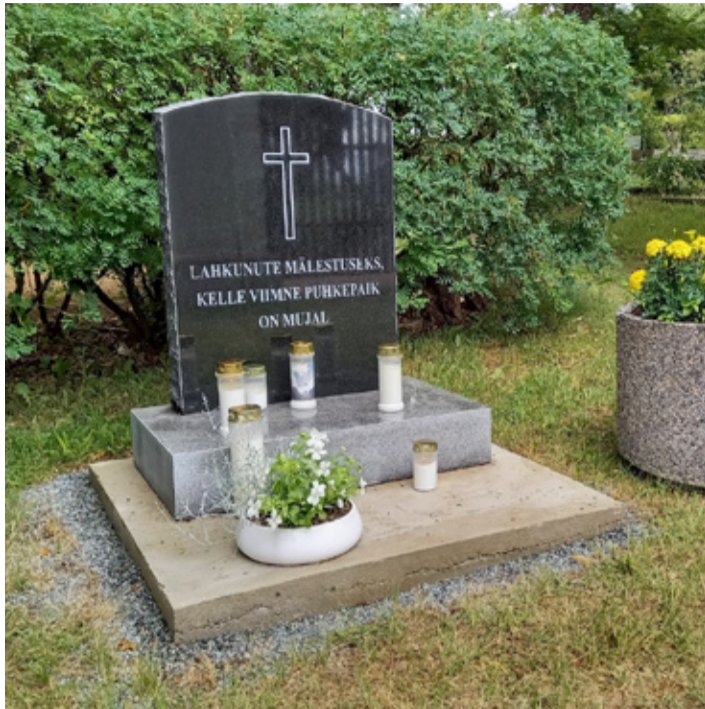
9. juulil pühitseti Kunda kalmistul mälestuskivi neile, kelle viimne puhkepaik on mujal.

XIII noorte laulupeol „Püha on maa“ osalesid Kunda Ühisgümnaasiumi tütarlastekoor ja mudilaskoor ning Viru-Nigula poistekoor.