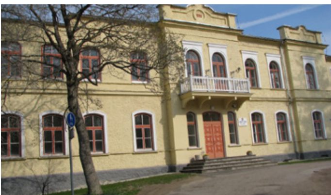
Fotod direktorite mõisast. Hoone enne (ülal) ja nüüd.

sus Eesti Tantsuagentuur vaatataid sukelduma põnevasse tänavatantsu maailma - etendus mitmetasandiline, kaasaegne ja kõnetav tantsulavastus Muutus. Samuti