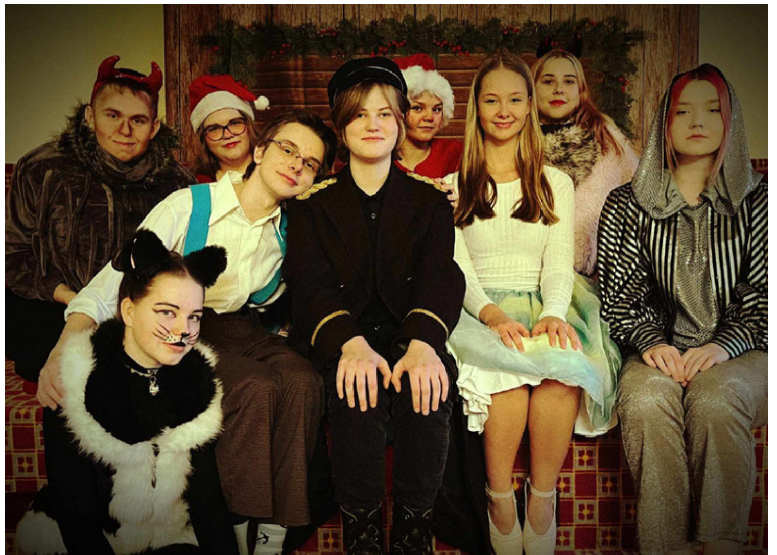
Fotol noored näitlejad.