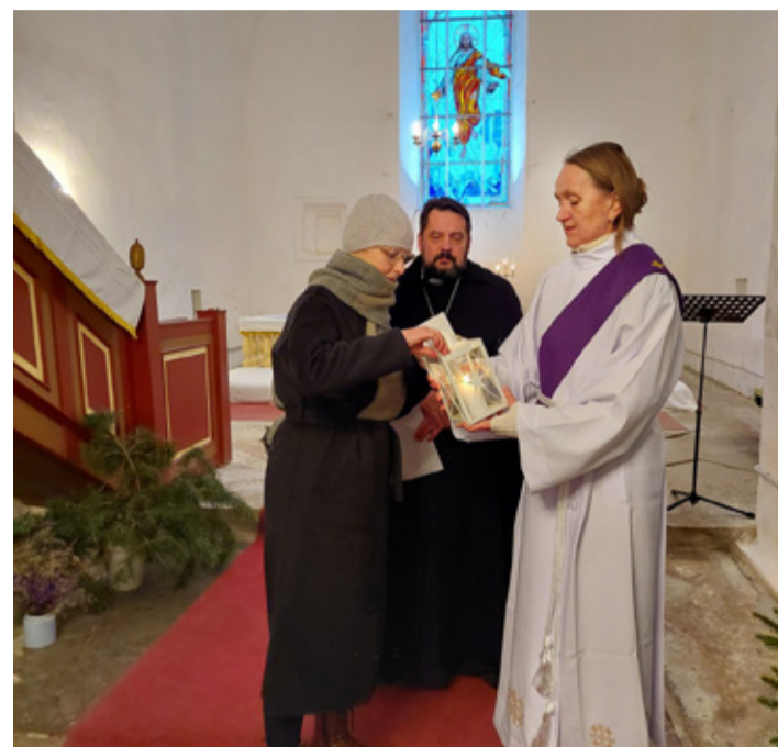
Vasta Kooli 1. advent Viru-Nigula kirikus.