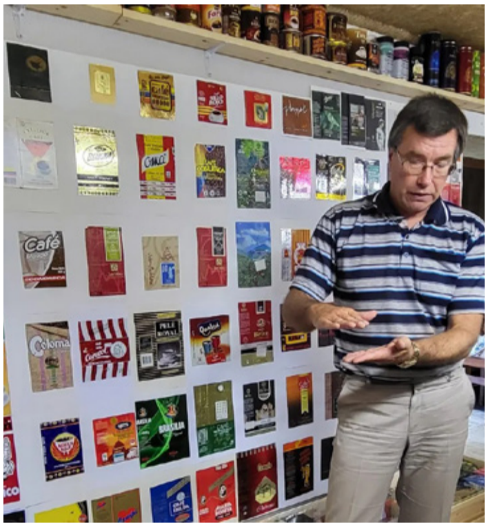
Kabeli külas avati kohvipakimuseum.