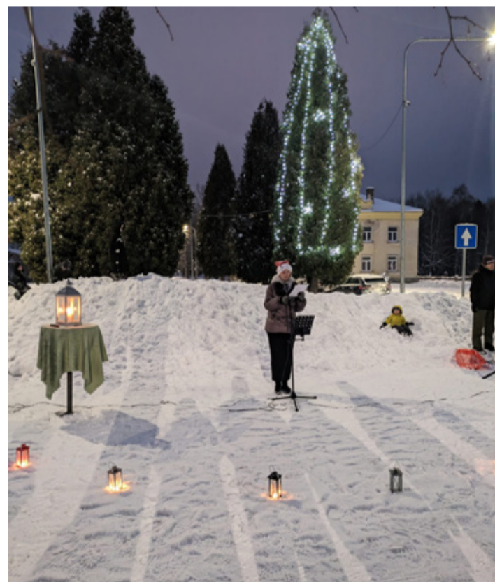
1. advent Aseri keskväljakul.