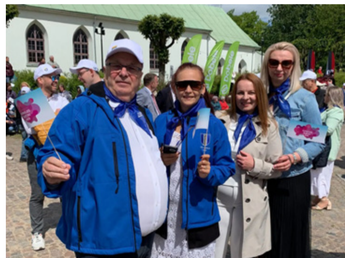
Juuni esimesel nädalavahetusel osales valla esindus Läti sõpruslinna Dobeles Sireli festivalil.