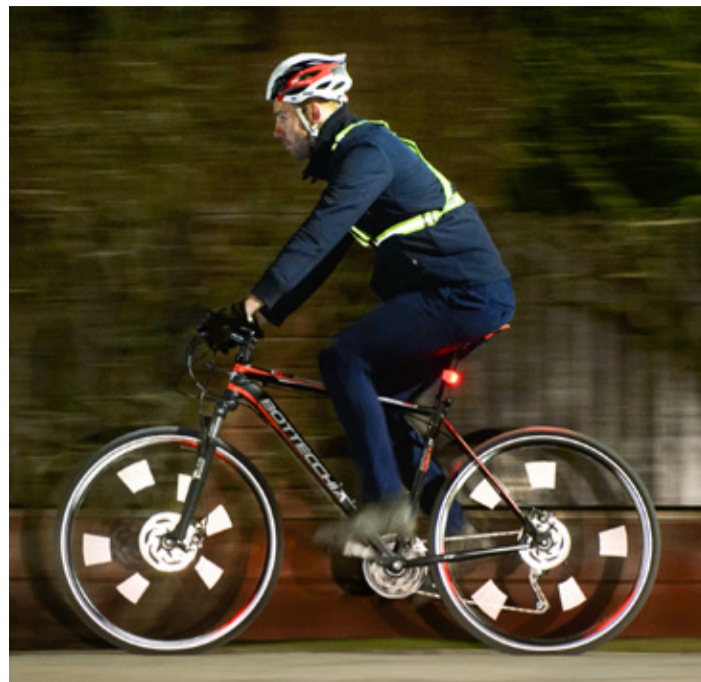
Eeskujulik jalgrattur.

• Hoolitse ka oma lemmikloomade eest – poodides on müügil erinevaid lemmikutele mõeldud helkurtrakse, vilku-