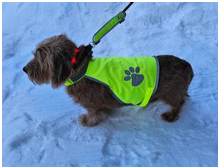
Ka lemmikloomad võiksid olla liikluses nähtavad.

• Jalgratturina veendu, et sinu rattal on ees valge ja taga punane helkur ning tuli ja kodarahelkurid. Puhasta need kindlasti enne sõitma minekut ära. Kas teadsid et jalgratta kodaratele on olemas efektsed, lihtsalt paigaldatavad sertifitseeritud pulgad, mis helgivad